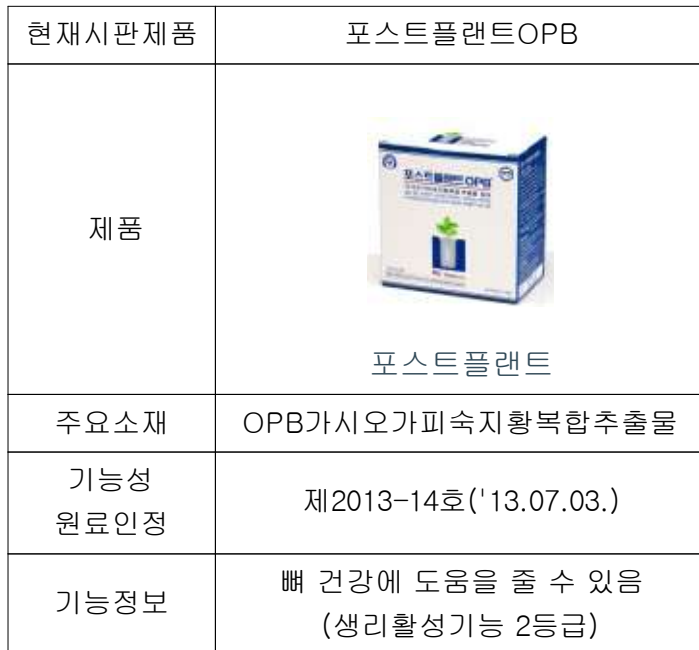
표. 오스코텍 건강기능식품 완제품 및 소재현황

당사는 자체 개발한 개별인정형 소재인 가시오가피숙지황복합물[OPB]을 함유하여 임플란트 고정에 중요한 역할을 하는 『포스트플랜트OPB』 제품을 치과병의원에 공급하고 있습니다.